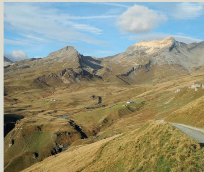
Die beiden Alpen Curtginatsch und Nurdagn gehören zur wertvollen Moorlandschaft Alp Anarosa.

Fahrplan Bus alpin Beverin unter www.busalpin.ch